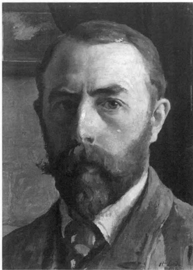
Hermann Linde (1863–1923), Selbstporträt, 1905, Öl auf Pappe, 36 x 25,5 cm.

Alle Figuren sind in kleinen oder originalgroßen Zeichnungen vorgearbeitet, manche in sehr zahlreichen. Da geht es zum Beispiel bei einer segnenden Gestalt darum, wie hoch sie den Arm erhebt, wie die Fingerhaltung ist, was der zweite Arm tut, wie die Fußstellung ist. Für jedes dieser Probleme gibt es gesonderte Vorzeichnungen, die verbessert, verändert, neu geschaffen werden, zuerst in kleinen, dann in großen Formaten, bis Linde mit der Lösung einverstanden sein kann. Hat er die endgültige Lösung gefunden, dann wird sie proportionsmäßig exakt, aber in freierer Form in die Farbe übertragen. In den Ansprachen nach Lindes Tod sagte Steiner, daß Linde als Maler an sich selbst Ansprüche gestellt hat, wie sie niemand anderes gestellt hätte. Auch bei diesen Motiven, die mehrheitlich in einer jenseitigen Welt spielen, wird überwiegend der Aufbau Vordergrund – Mittelgrund – Hintergrund und die Dreiteilung Zentrum, Seiten beibehalten.